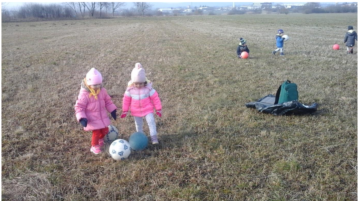
Slika 4: Izlet na travnik – igra z žogami

Izleti na travnik so se izvajali v okviru treh programov, v katere je bil vključen oddelek (Zdravje v vrtcu, Gozdna pedagogika in Mali sonček). Otroci v oddelku so vrtec pričeli obiskovati šele v tem vrtčevskem letu in opaziti je bilo težave pri hoji po travniku (čeprav smo naravo pričeli obiskovati v zimskem času, ko je trava posušena). Otroci so po travniku izvajali prve, negotove korake, nekateri so za premagovanje poti potrebovali pomoč odraslega. Po večkratnem obisku travnika so otroci postali kompetentni pri gibanju na neravni površini – tako pri hoji kot pri igri. Od januarja do maja smo izvedli 10 izletov. Starši so bili spodbujeni, da izlet izvedejo tudi v družini.