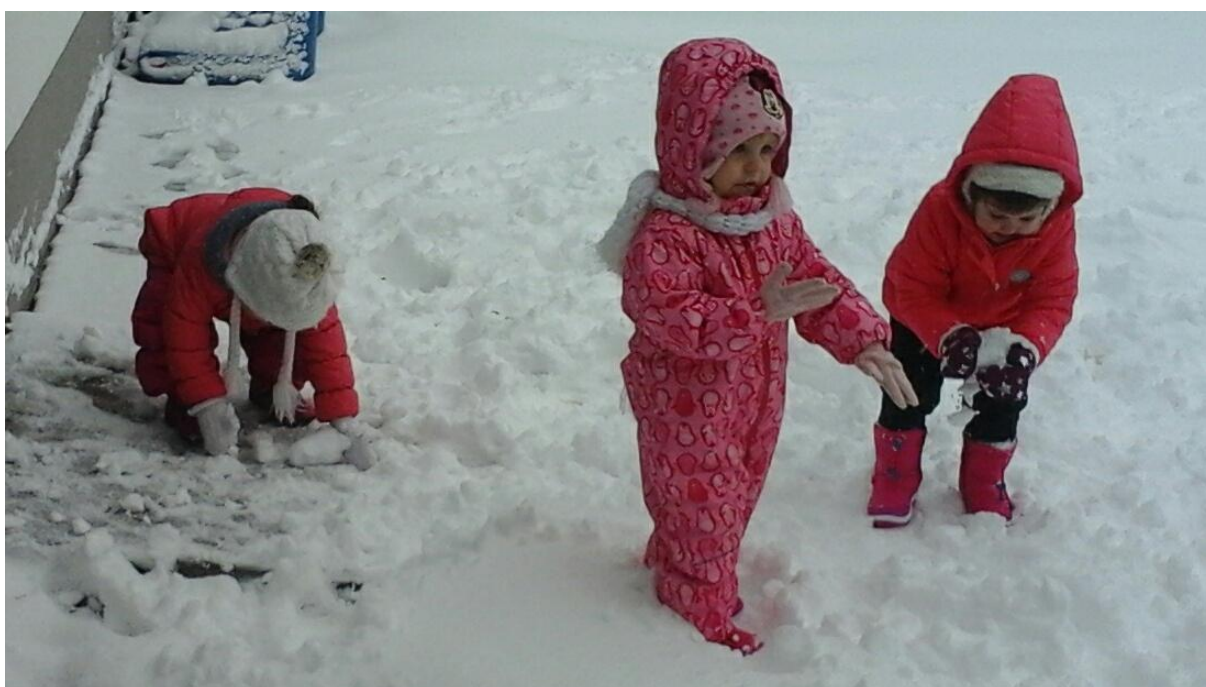
Slika 11: Prvi sneg