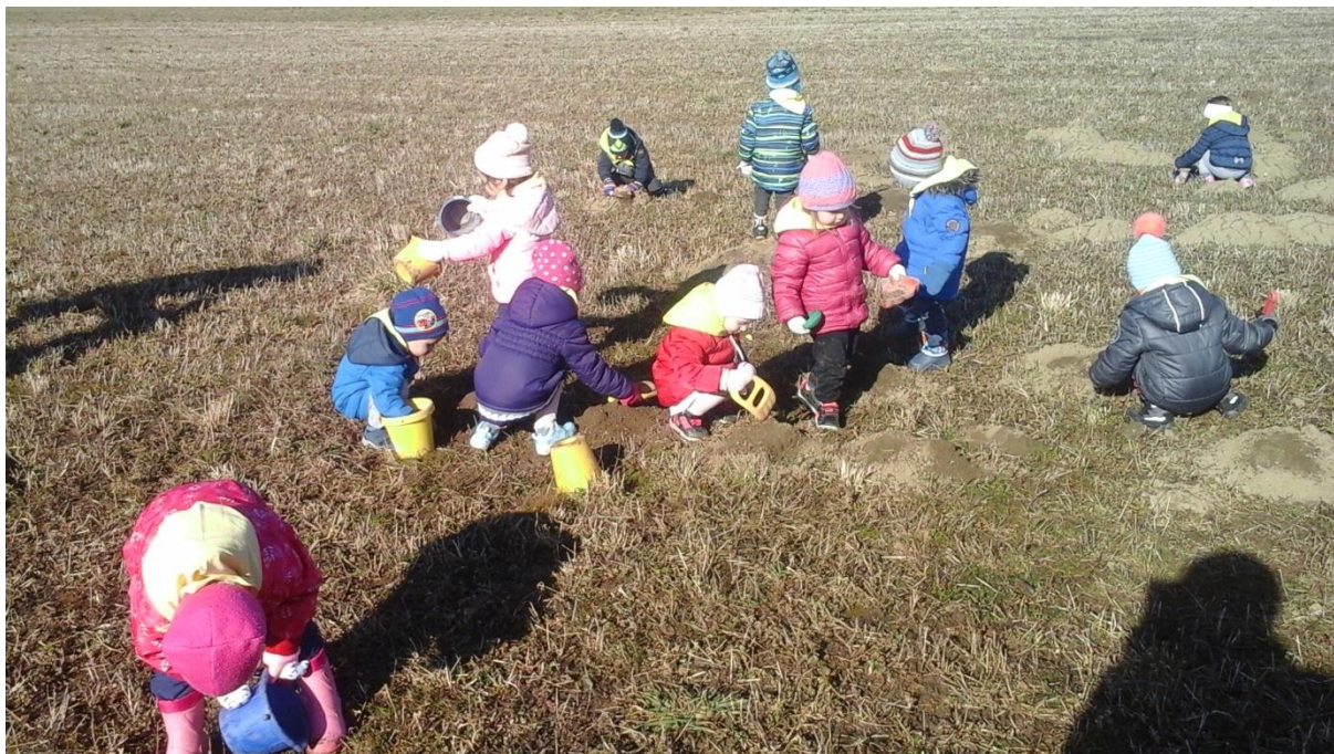
Slika 5: Izlet na travnik – uporaba posodic