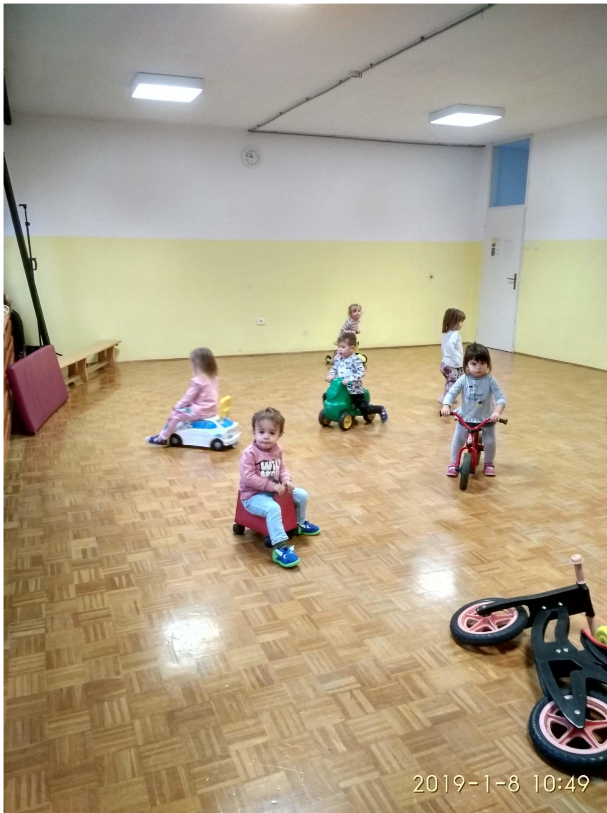
Slika 2: Vožnja