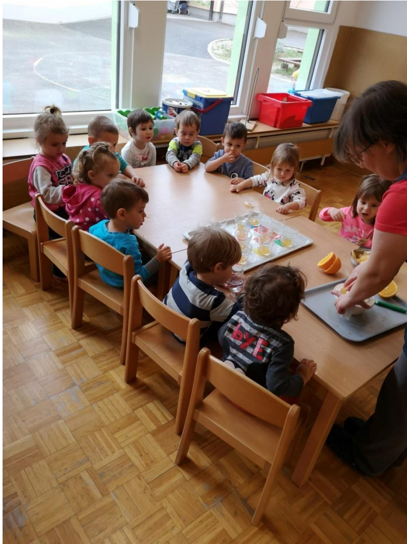
Slika 7: Sok iz sveže stisnjenih pomaranč