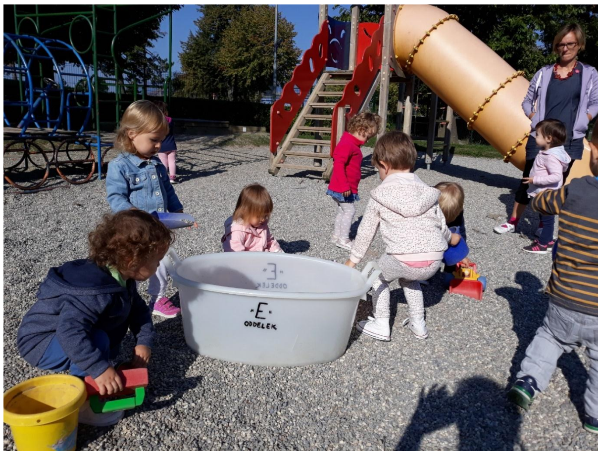
Slika 8: Igra na igrišču