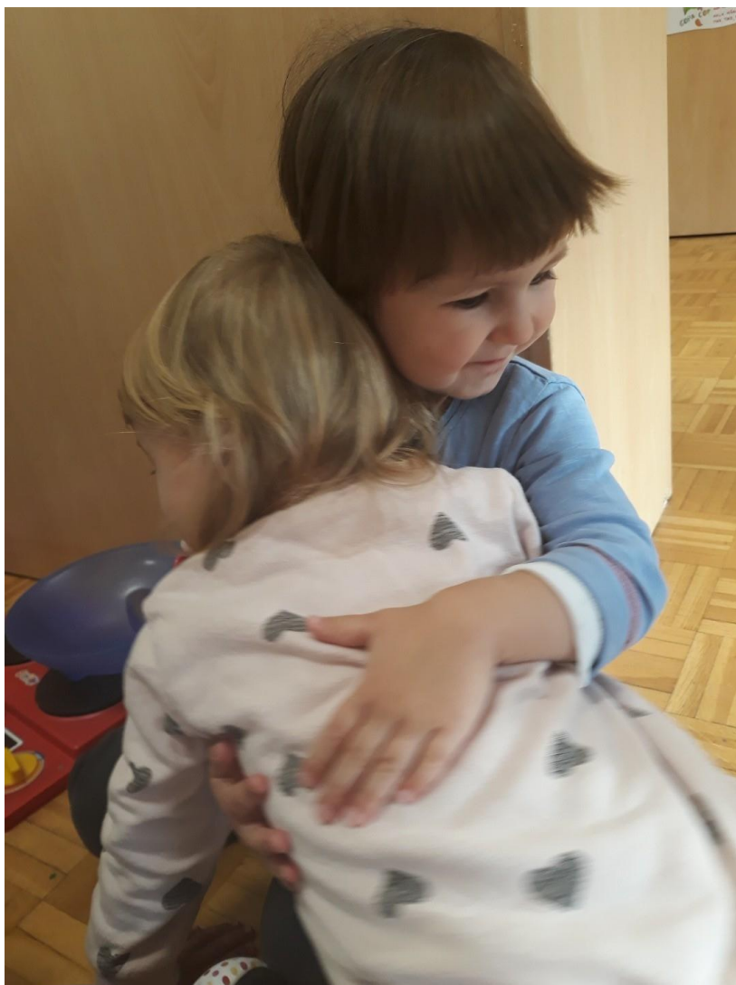
Slika 9: Socialni razvoj otrok