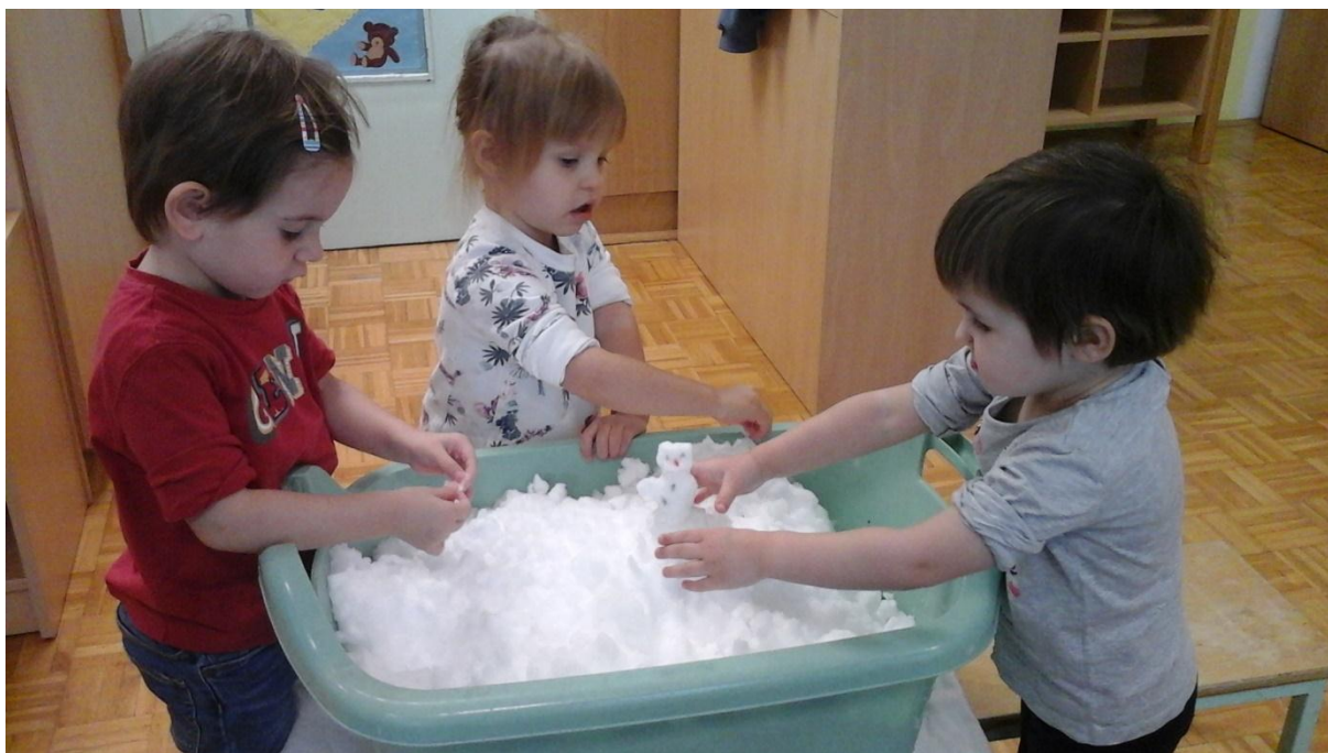
Slika 10: Sneg v igralnici