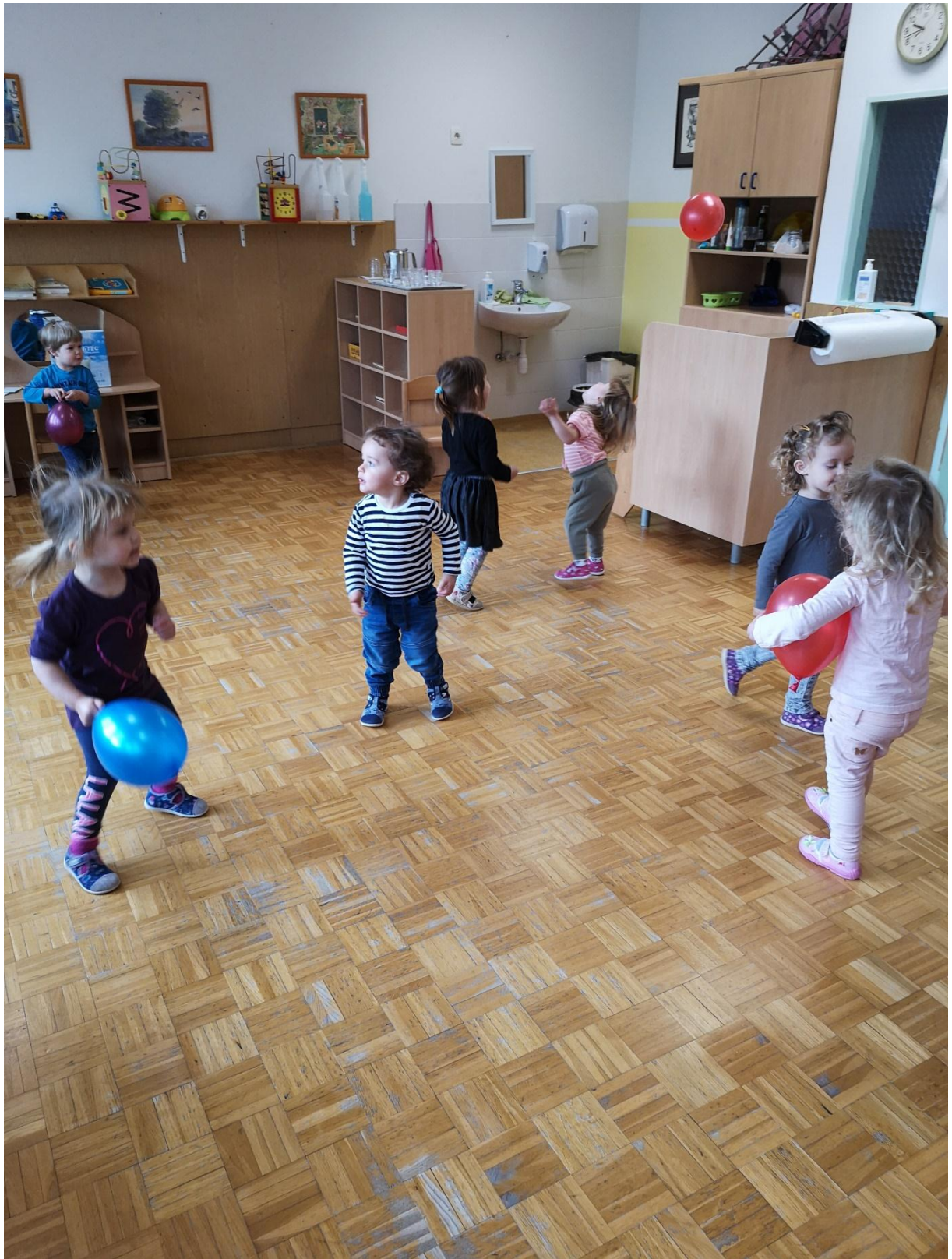
Slika 3: Igra z baloni