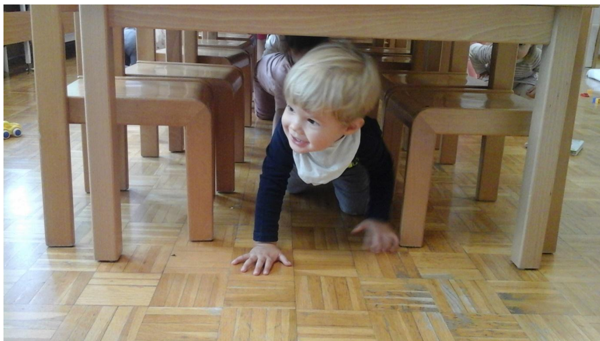
Slika 1: Naravna oblika gibanja

V oddelku smo izvajali program Modri sonček. Ker smo želeli, da postane gibanje del našega življenjskega stila, smo vzeli program za svojega in posamezno nalogo razširili z dejavnostmi, ki so otroke pripravile na zaključno izvedbo naloge. Dejavnosti so se izvajale preko celega leta, zajemale so naloge na prostem (travnik, igrišče ...) in v vrtcu (igralnica, telovadnica). Pri izvajanju dejavnosti so sodelovali tudi starši oz. otrokova družina.